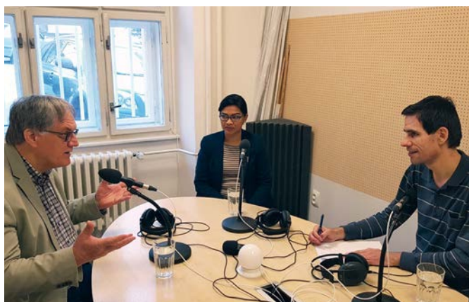
Rozhovor v pražském studiu Kristián Radia Proglas