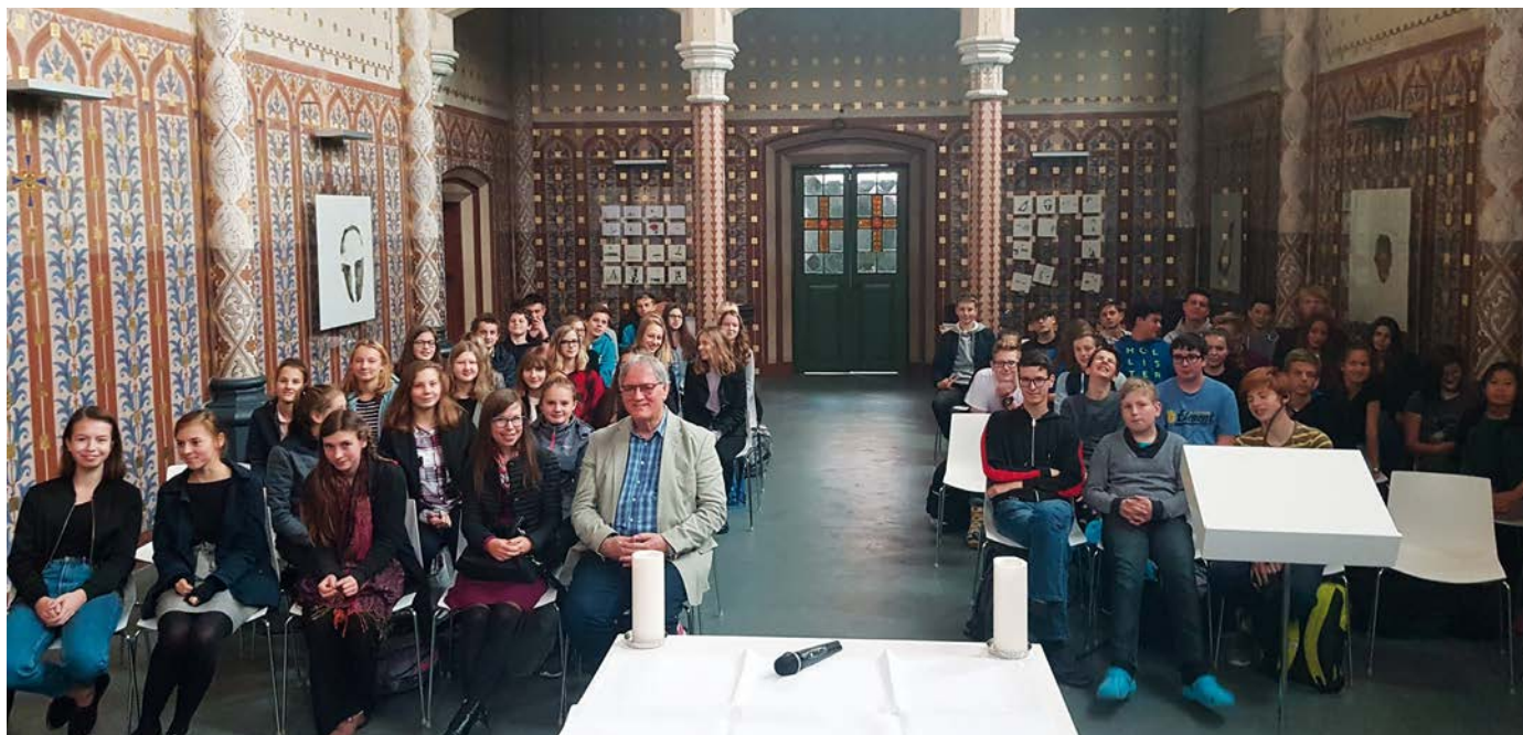
Přednáška pro studenty Biskupského gymnázia v Českých Budějovicích