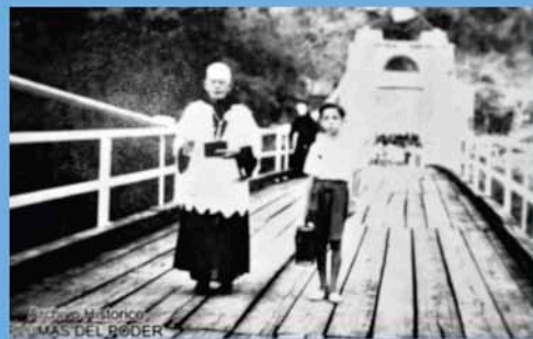
Kněz vede malomocného chlapce do Aqua de Dios. Z tohoto místa již nebylo možné odejít.

LL zde vedle obuvnické dílny (kde se vyrábí speciální obuv pro malomocné) rozvíjí chráněnou dílnu, kde mohou bývalí pacienti nacházet uplatnění. Agua de Dios dnes znamená domov pečující o malomocné.