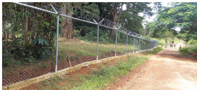
Veřejná sbírka – Nově oplocená příjezdová cesta do nemocnice Ganta