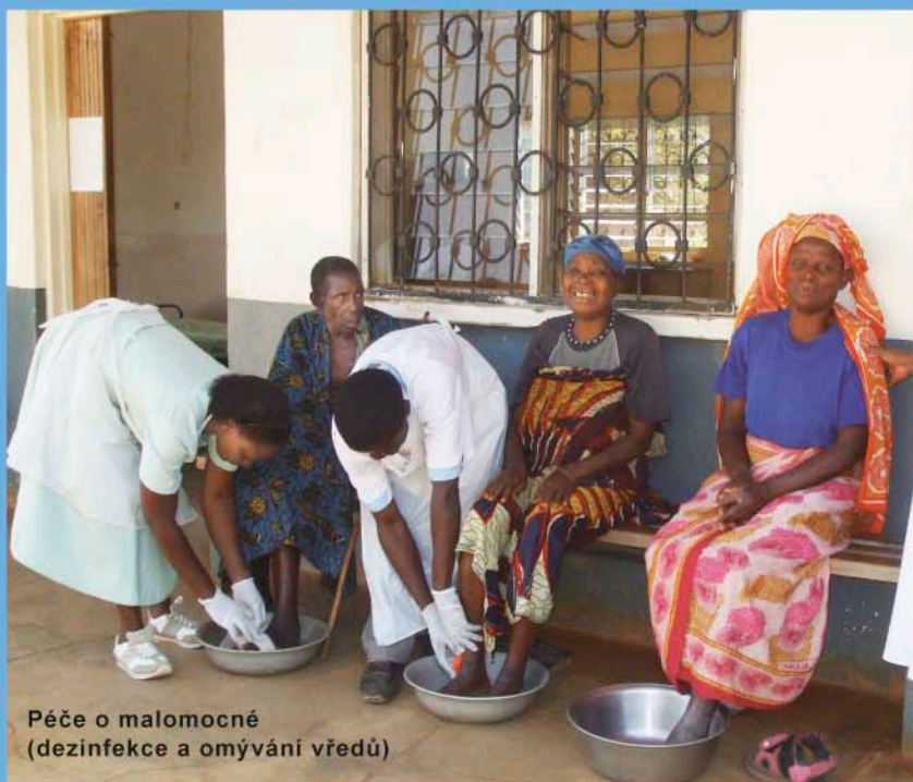
Péče o malomocné (dezinfekce a omývání vředů)