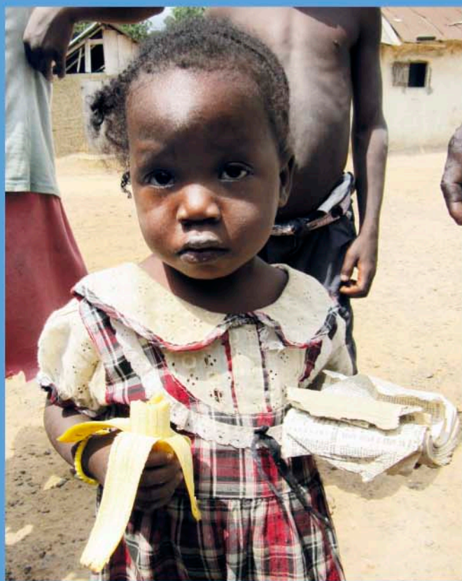
Naše pomoc se týká i těchto nejmenších, Libérie

Jsou pro nás radostným svátkem, protože věříme, že po Kristově ukřižování následovalo zmrtvýchvstání. Celá radost velikonočního poselství není v ukrutnosti lidské zloby, před kterou se nezastavila Kristova láska, ale především v překonání zla dobrem, smrti životem, tedy kříže zmrtvýchvstáním. Proto můžeme na kříž hledět očima víry a není to zdrojem myšlenek na nějaký sadismus nebo podobné zvrácenosti. Kříž se naopak stal symbolem křesťanů, protože věří, že po kříži přišlo definitivní vítězství dobra.