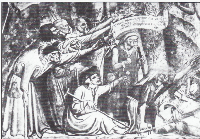
Malomocní v CAMPOSANTO v Pise – TRIUMF SMRTI.

Některé řády se jich ujímaly, staraly se o ně, obvazovaly jim rány a utěšovaly je, ale neuměly je vyléčit. Tyto četné stanice pomoci malomocným pak ale tím, že již v různých částech světa dávno existovaly, zasáhly radikálně proti této nemoci, když byly konečně objeveny léky, které dovedou absolutně zničit bacila lepry v těle. V osmdesátých letech min. století byla pak nasazena MDT (Multidrugterapie - tzv. „koktejl 3 léků“), což znamenalo – KONEČNĚ JE LEPROSA VYLÉČITELNÁ!