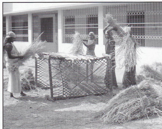
Takto se „mlátí“ rýže z první úrody na „naší“ farmě.