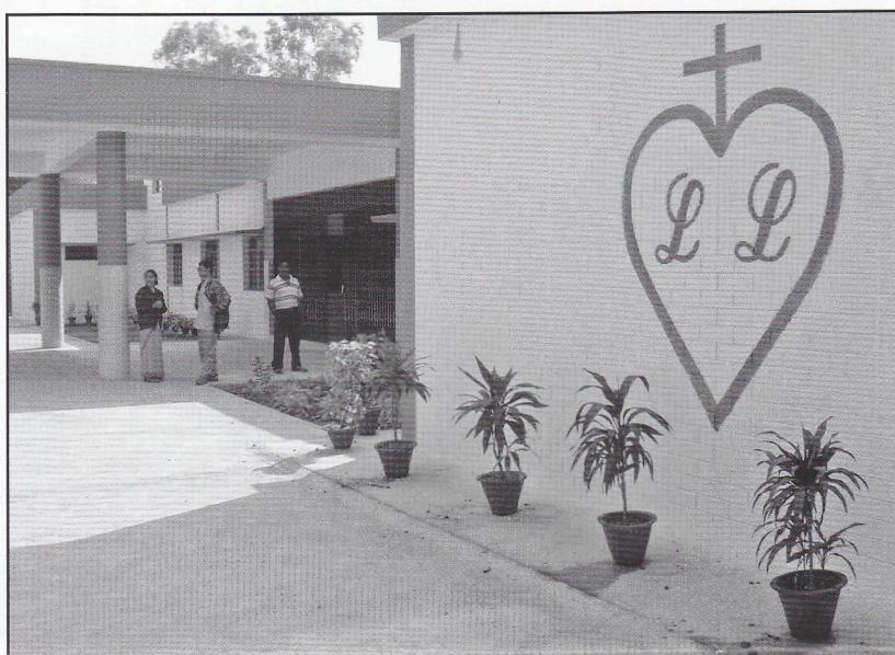
Hlavní vchod do „naší“ nemocnice.

Ježíška v srdci nosím je bos a je tak malý že vejde všem dětem světa v ráj jejich srdcí