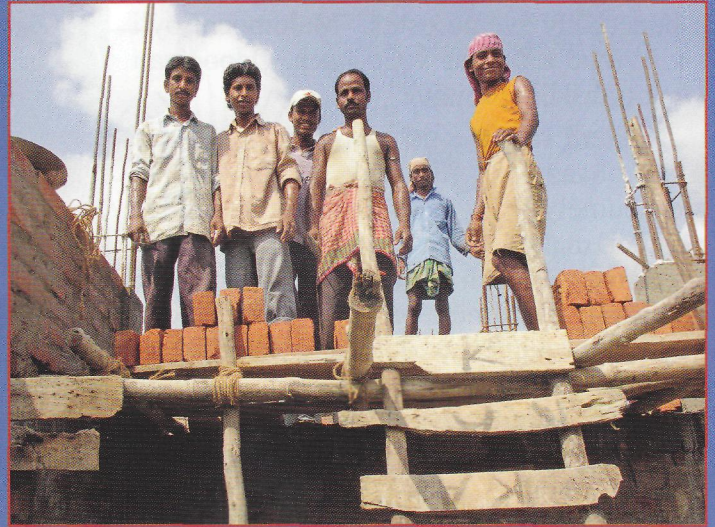
Foto vlevo nahoře: Bohoslužba v átriu hrubé stavby dispenzáře se studenty ze St. Xavier. 3 týdny kopali jámu pro rybník na vodu pro období sucha i pro nasazení chovu ryb. Foto vpravo nahoře: Indičtí zedníci v Phulpahari u Midnapure