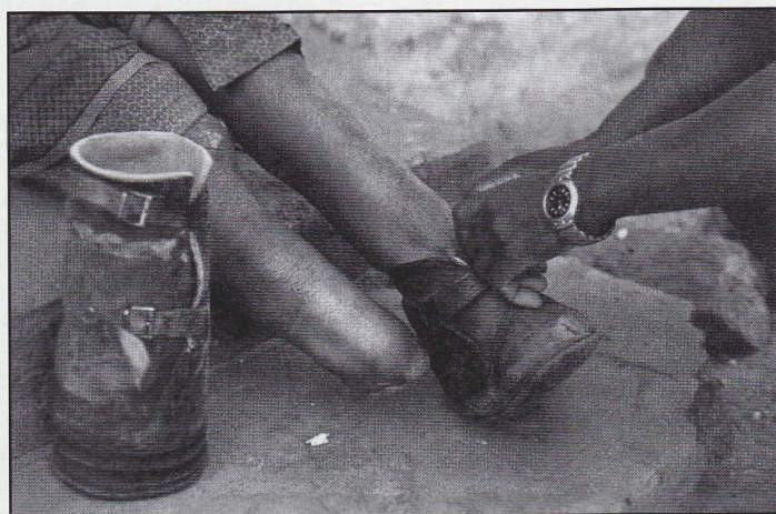
Péče o invalidy – ortopedická obuv