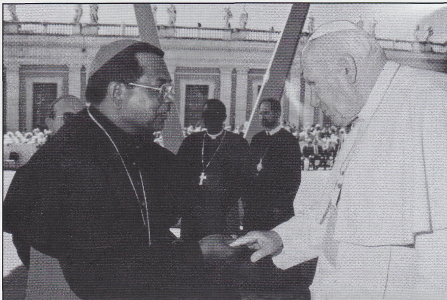
Most. Rev. Felix Toppo SJ po svém vysvěcení u sv. Otce v Římě.

LL má zájem, aby hlavním základem péče o celý komplex byl stálý personál a to je podle našich zkušeností vždy rád. Nemocniční zařízení, která vedou řádové sestry a bratři jsou ekonomická a nejspolehlivější. Hlavně tyto misie dostaly v Třetím světě lepru pod kontrolu. Z bývalých 15ti milionů akutně malomocných před 15ti lety podle WHO klesl počet registrovaných případů na 760.000. Zůstává 3 miliony invalidů obětí lepry, odkázaných na pomoc.