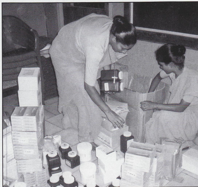
Přebírání léků v Lepra kolonii – Zahradu Papeže Jana – Don Bosko Beatitudes, Chennai, Madras.

Zásilky léků se rozvíjejí i do dalších oblastí světa jako je např. Nepal, Filipíny a znovu Etiopie a Tanzánie. Stále zásobujeme „naše“ tradiční leprastanice.