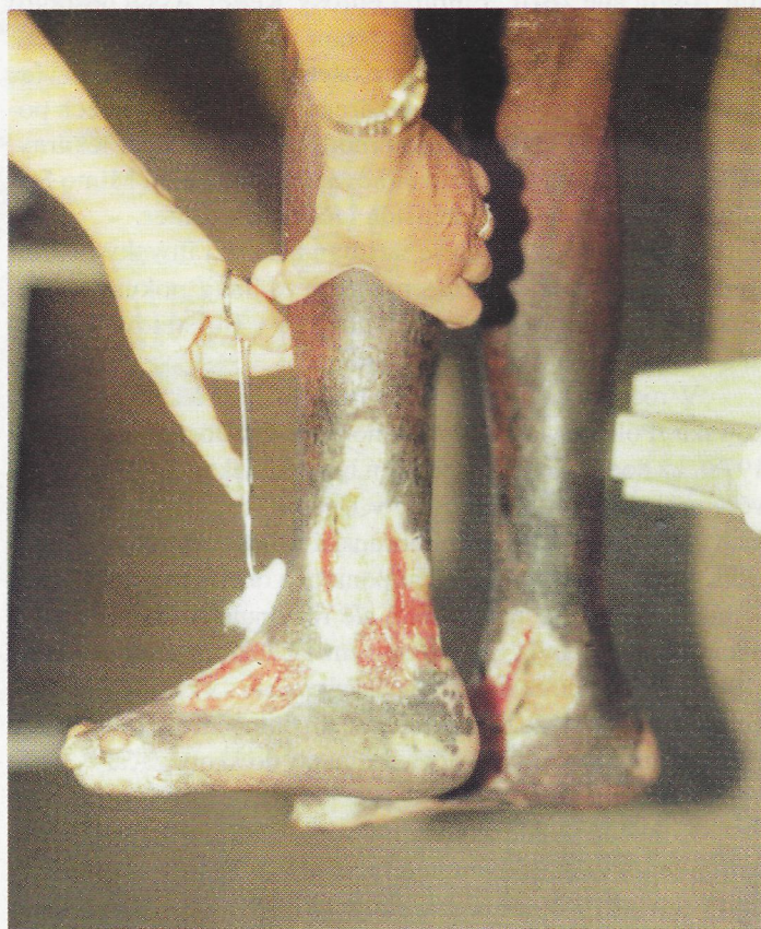
Z leprosária BRAZZAVILLE, CONGO, AFRIQUE Congregation des Soeurs de St. Joseph Mission Catholique