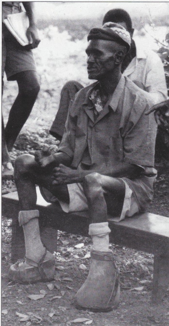
Tento obyvatel Buluby je v trvalé péči misie. Na nohou má speciální obuv z vylehčeného materiálu

v roce 1990 snížení počtu malomocných na 300. St. Francis Leprosy Centre - Buluba měla v roce 1994 své šedesáté výročí a stává se Národním léčebným centrem malomocenství. Přejímá Program Lepra-TBC. Centrum je dnes považováno za centrum znalosti o lepre a jejím léčení.