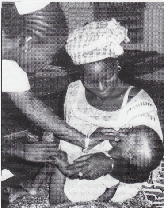
BULUBA a její pobočky jsou útočištěm pro všechny matky, které mají nemocné děti.

Konečně se zde započalo v roce 1982 s nejnovějším léčením lepry kombinovanou terapií MTD. Buluba měla tehdy 240 pacientů, v domově pro staré 42 osob a ve více jak osmdesáti menších střediscích 3000 pacientů. Kombinovaná terapie MTD způsobila ve vybraných kontrolních oblastech