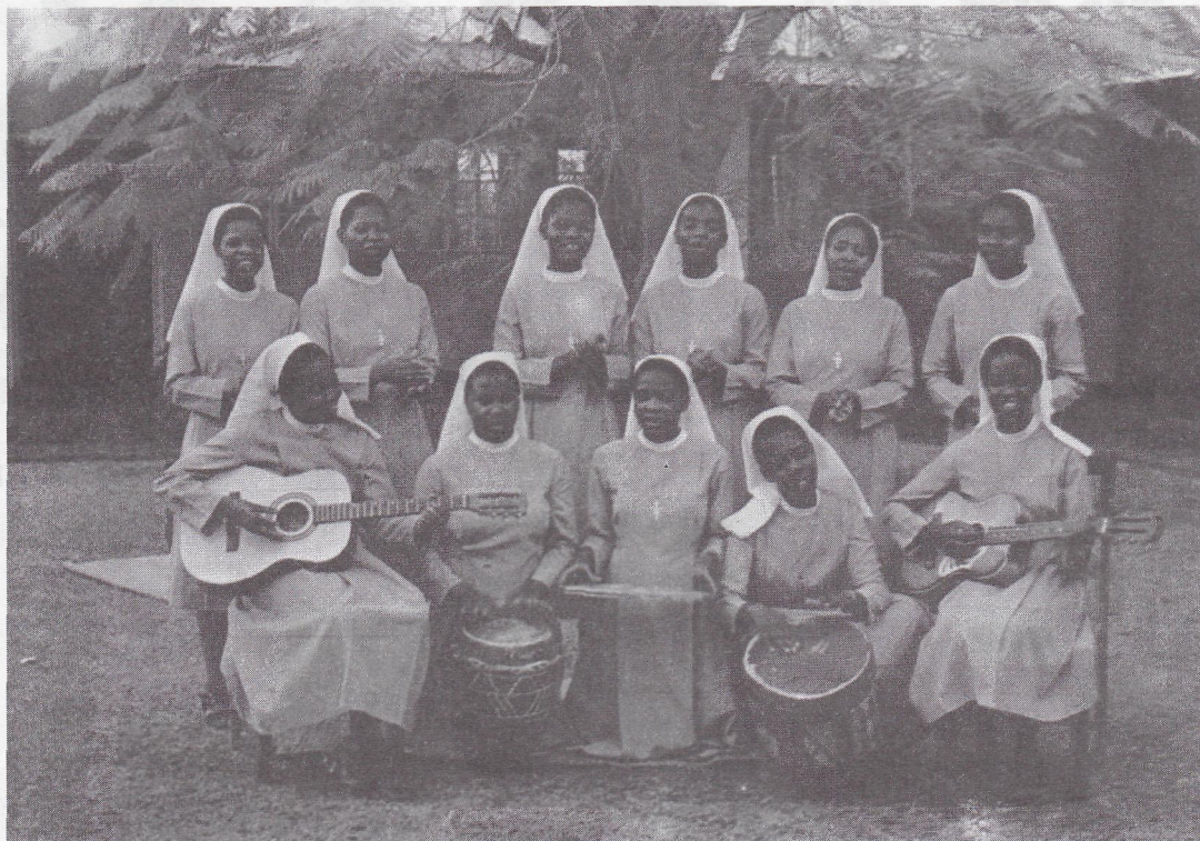
Novicky z misie sv. Terezy

Na obou fotografiích vidíte, jak to vypadá po několika desetiletích dobré práce misionáře v misiích. Už tu jsou černé sestřičky. Přebírají iniciativu. Neodpustili jsme si, abychom Vám nepředstavili „džez bend“ černých sestřiček a rovněž i průvod na Boží tělo tamních skautek s palmovými ratolestmi.