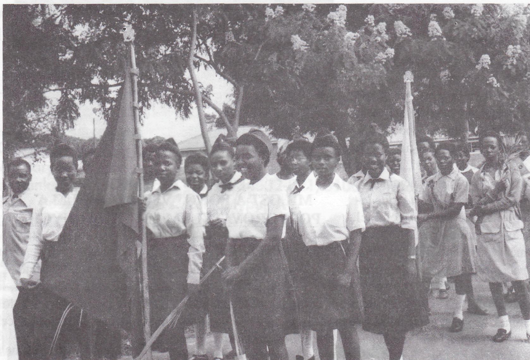
Skautky v průvodu na Boží Tělo

Z těchto důvodů naše LL i nadále zásobuje misii sv. Terezy léky. Máme radost, že už existují i v Africe místa, kde vládne pokoj a mír a tvořivá práce přináší své výsledky.