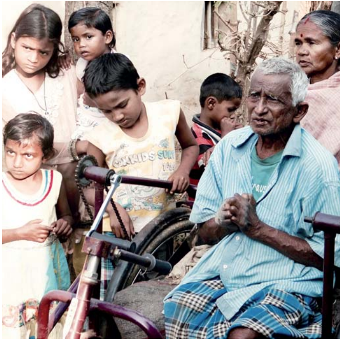
Statisíce lidí jsou, vinou nezájmu ostatních, stále sužovány malomocenstvím – nebojme se jim pomoci!