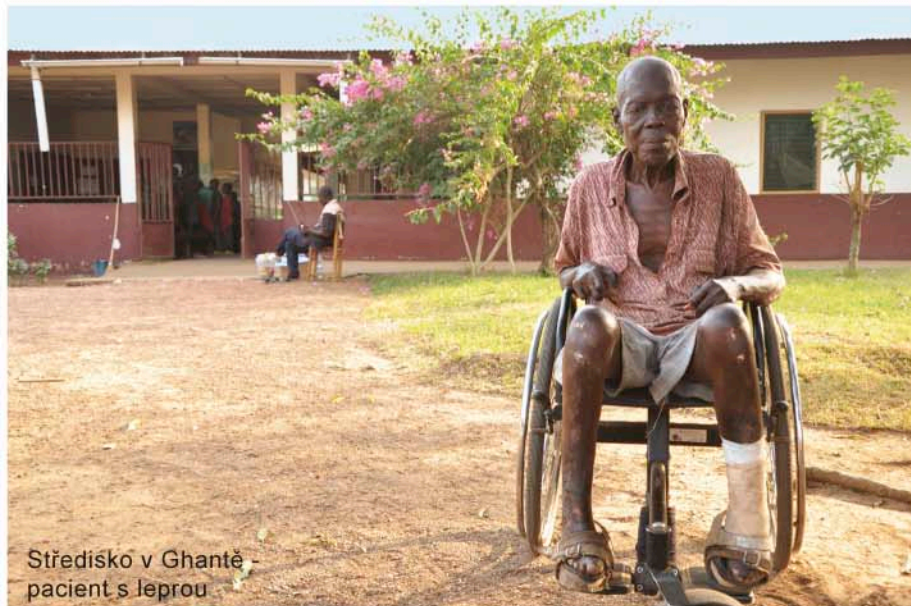
Středisko v Ghantě pacient s leprou

Novým hlavním projektem pro Likvidaci lepry se stalo Rehabilitační středisko v Ghantě na severovýchodě Libérie (ve spolupráci s DAHW, která vykonává kontrolu kvality na místě). Činnost v této oblasti započala italská řeholní kongregace v roce 1974, trvala i v době občanské války po roce 1989 a trvá až dodnes. V roce 2011 převzala ve spolupráci s místním biskupstvím naše partnerská organizace DAHW organizaci střediska a v roce 2014 přebírá tuto zodpovědnost Likvidace lepry z ČR! Toto středisko jsem osobně navštívil a mohl tak poznat, jak zde vypadá běžný život a především jsem se zděšením zjistil, že zde je lepra přítomná v těch nejhorších formách – asi jak to bylo v Indii před 20 roky.