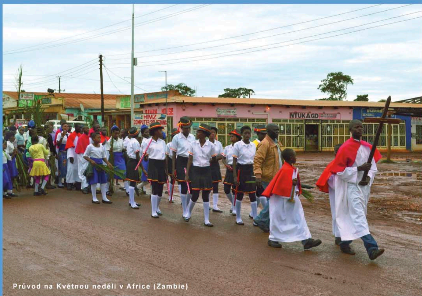
Průvod na Květnou neděli v Africe (Zambie)

Z Jeruzaléma vyšly zástupy naproti Pánu; děti mávaly olivovými ratolestmi a všichni volali: Hosana na výsostech. (z liturgie Květné neděle)