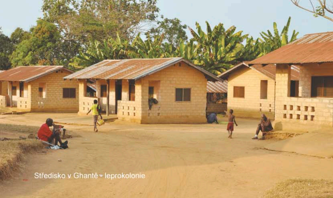
Středisko v Ghantě - leprokolonie