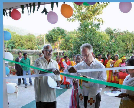
Slavnostní stříhání pásky při otevření sirotčince Bambino