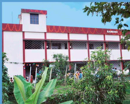
Celkový pohled na sirotčinec Bambino, požehnaný a otevřený 16. 12. 2012