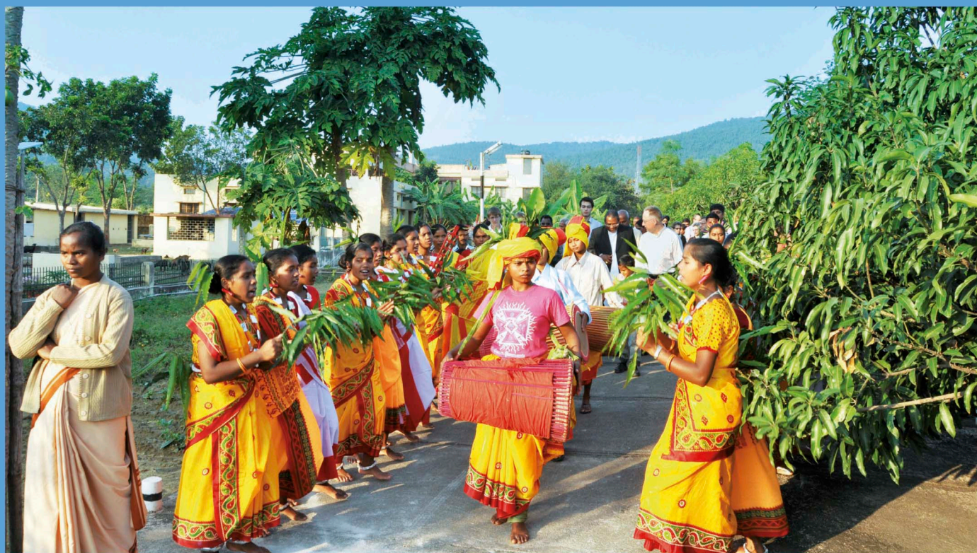
Průvod se zpěvem a bubnováním, kterým začalo slavnostní požehnání a otevření sirotčince

O tevření sirotčince, pojmenovaného po Pražském Jezulátku „Bambino“, který byl postaven z Vašich darů, je pro všechny příležitosti poděkovat nejprve Bohu a zasvětit Jeho ochraně dětí, které tu budou prožívat první roky svého života (cca od 3 do 6 let), a pak také důvodem ke společné radosti.