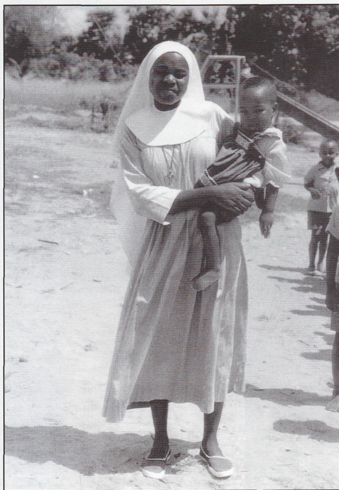
Z Afriky: dnes již v misiích většinou slouží domorodé sestry

„...Nyní je tu přes 60 stupňů celsia, sotva vylezete z koupelny (resp. z kýblu), tak z vás tečou potoky potu... ale indické teplo má něco do sebe.“