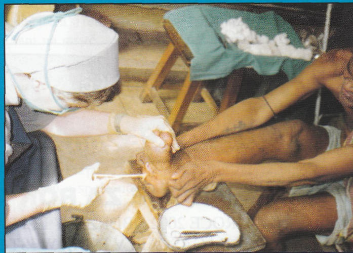
I naše sestry boromejky ošetřují rány malomocných v nemocnici Nirvala -Indie, jižní Bihar.

KONTO: LL - LIKVIDACE LEPRY, Londýnská 44, 120 00 Praha 2 Komerční banka a.s. Praha - město 34532 - 021/0100 Var. symbol: 1500 Konst. symbol: 379