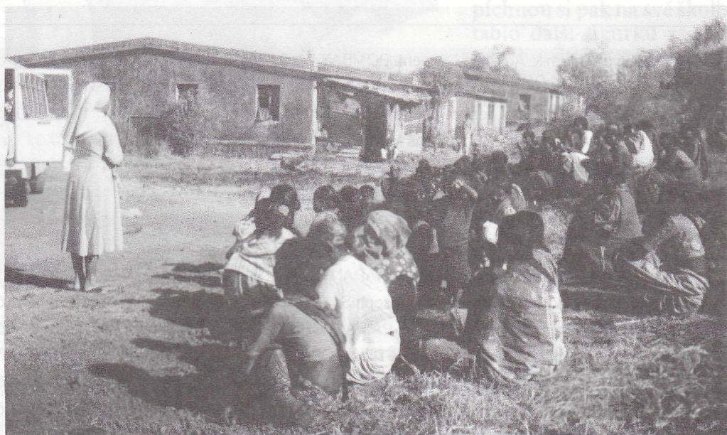
Privězli pomoc z misie. V pozadí domky domorodců.

Na rok 1995 jsme letos v únoru nabídli misii v Kune opět léky a poslali 7 000 marek na pomoc této misii. Některé léky, které nejsou na blanketu Act. Medeor si misie musí dokupovat v Indii, některé nemocné musí posílat do nemocnice do města, atp.