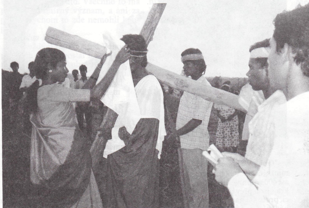
Tak slavili Velikonoce lidé z Kume v Indii, řečení "Adivasis", kdysi z Afriky do Indie dovezení otroci.

1/95 LL-LIKVIDACE LEPRY Společenství pomocníků misijních leprosáří